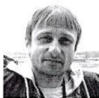
Судья при участниках