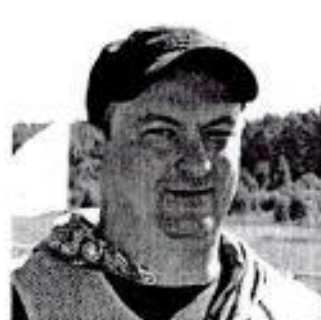
Старший судья бригады Парка Сервиса