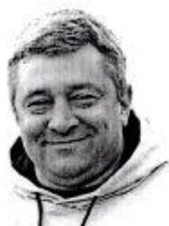
Руководитель гонки (Главный судья)